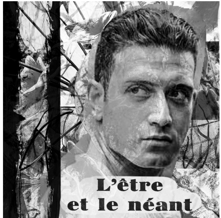
Abb. 2 Omar Sharif Jr. In Being and Nothingness , Wayne Koestenbaum, 2016

Ein anderer meiner Instagram-Posts kann nun als Coda unseres Gesprächs über Celebrity-Kultur dienen: Für diesen Post habe ich aus dem Internet ein Foto von Omar Sharif Jr. heruntergeladen, einem offen schwulen Star, der zufällig der Sohn eines noch berühmteren Vaters ist, Omar Sharif. In meiner Collage habe ich dieses Foto von Sharifs filis mit der Formulierung Being and Nothingness zusammengestellt, dem Ausschnitt aus einem heruntergeladenen Foto von der Titelseite der englischen Übersetzung von Sartres Band. Ein Hashtag für meinen Post war #remakes. Ein anderer war #beingandnothingness. Ein anderer war #omarsharifjr. Die Überschrift meines Posts: «Omar Sharif Jr. in Being and Nothingness ». Ein paar Tage, nachdem ich dieses fiktive Filmstill eines imaginären Remakes eines Buches – Das Sein und das Nichts , das niemals nachvollziehbar die Grundlage eines Films abgeben könnte gepostet hatte, habe ich erfreut festgestellt, dass Omar Sharif Jr. das selbst mein Post <geliket> hat. Omar Sharif Jr. hat einen Instagram-Account; wer auch immer dafür zuständig ist, <mochte> bzw. <likete> meinen Post. Hat Omar selbst meine Collage gesehen? Hat Omar sie gewürdigt? Oder hat jemand, der für Omar arbeitet – der den Star vertritt – den Post gesehen? Ist